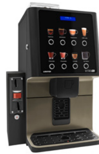
Kit Validierungsmodul Vorbereitet zur Installation eines Münzprüfers.