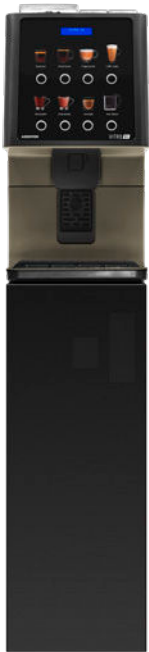
Kit Sockel Vorbereitet für Münzprüfer. (850 mm.)

Auch für den Kaffeeservice in Lebensmittelgeschäften ist sie die perfekte Lösung und für Hotels, in denen das Frühstück gut, aber ebenso schnell sein sollte, bietet die Maschine ein angenehmes Erlebnis, mit einem attraktiven Design, einfach und funktional.