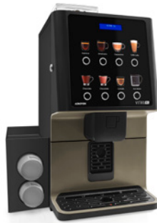
Kit Bechermodule Zum Spenden von Bechern.