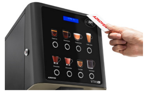
Kit RFID-Lesegerät Für Produktladekarten oder bargeldlose Systeme.